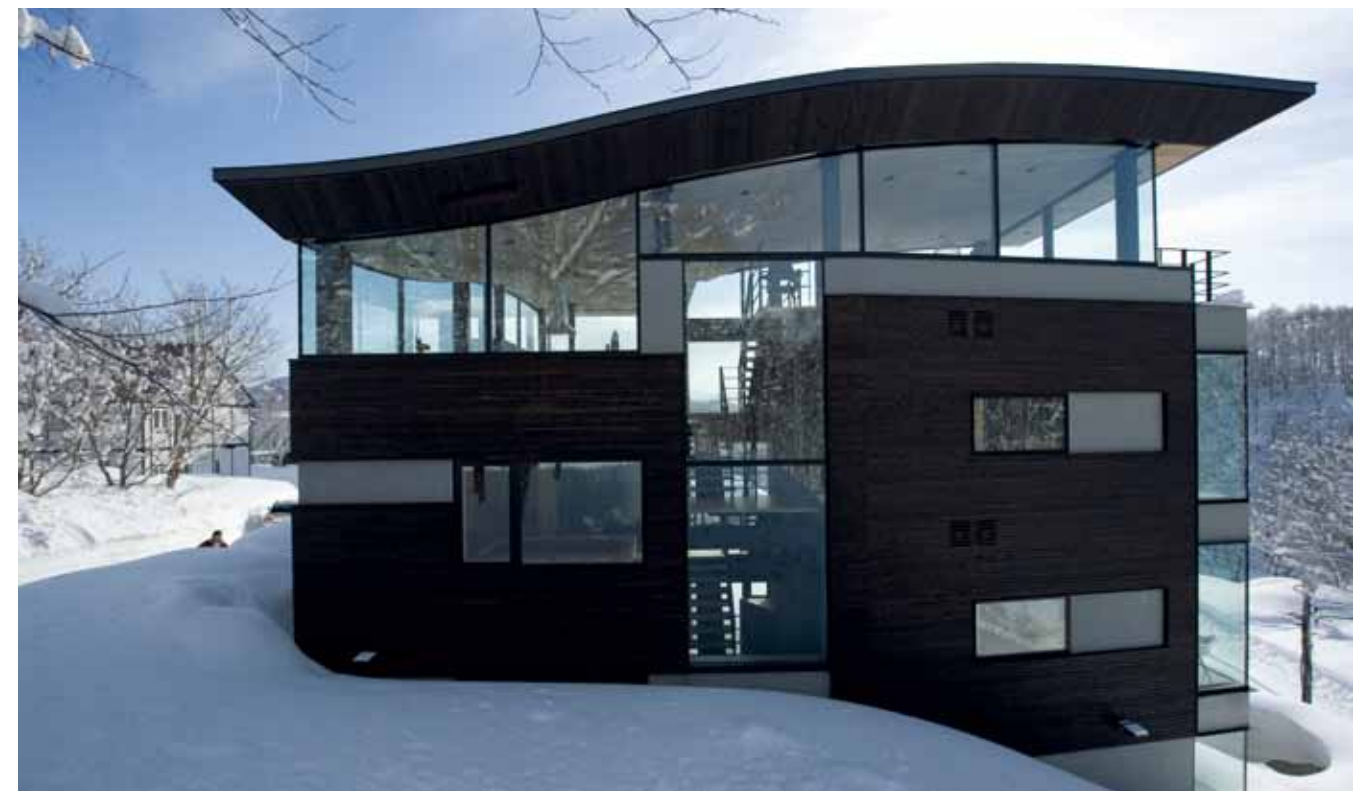
En bratt tomt omgitt av vakkert landskap og mye lys ga store muligheter og noen utfordringer. Bygningens L-form, halvetasjer og en svært bevisst plassering av vinduer var en viktig del av løsningen.

til nå bygd et boutique hotel, en fusionrestaurant, den private residensen Odin House og flere luksusleiligheter i Hirafu, som også er kjent for sine gode spisesteder og Nisekos mest pulserende uteliv.