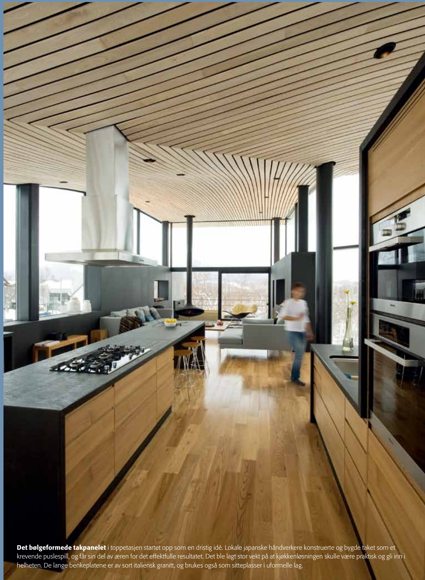
Det bølgeformede takpanelet i toppetasjen startet opp som en dristig idé. Lokale japanske håndverkere konstruerte og bygde taket som et krevende puslespill, og får sin del av æren for det effektfulle resultatet. Det ble lagt stor vekt på at kjøkkenløsningen skulle være praktisk og gli inn i helheten. De lange benkeplatene er av sort italiensk granitt, og brukes også som sitteplasser i uformelle lag.